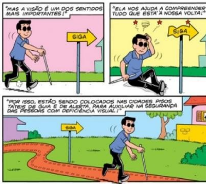
Figura 06 – Planejamento urbano inclusivo

Com a apresentação das dificuldades encontradas na locomoção de pessoas com deficiência visual, os leitores e leitoras começam a perceber situações ao seu redor antes despercebidas por não os afetar diretamente. A história em quadrinho lança luz para a importância de medidas inclusivas, o que evita acidentes e possibilita melhorar a qualidade de vida daqueles que precisam de transformações sociais e urbanas para uma melhor circulação no espaço.