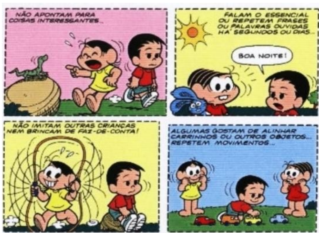
Figura 08 - Explicando autismo