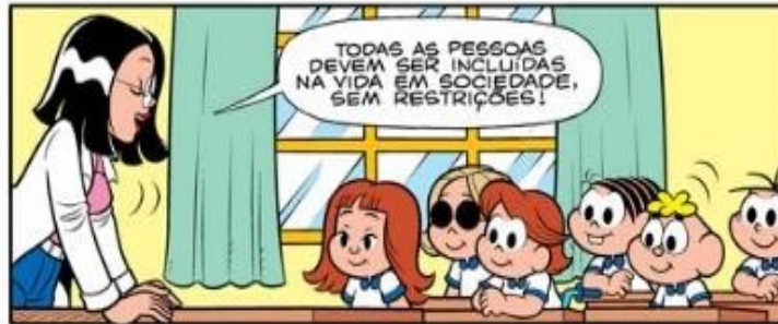
Figura 01 – Professora explica sobre inclusão

Em um quadro da HQ, publicada em 2011, a história se passa dentro de uma sala de aula, sob orientação da professora. Esta explica sobre a inclusão social para seus alunos e também comenta acerca de quão prejudicial é o preconceito entre as pessoas.