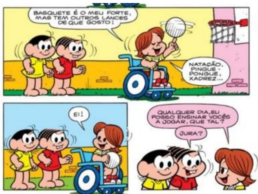
Figura 09 - Disposição para ensinar

Na figura acima, o destaque da narrativa recai nas habilidades de Luca nos esportes. A história possibilita que se reconheça que ele é bom jogador no basquete e na natação, principais modalidades esportivas com as quais se relaciona. Nas narrativas, o jovem dificilmente não acerta a cesta de basquete. Quando decide apostar corrida com seus amigos, vence-os igualmente. Isso se deve, no entanto, ao fato de que as corridas são realizadas com o auxílio de cadeiras de rodas, dando algum tipo de vantagem ao menino, uma vez que está habituado a se locomover com cadeira de rodas. Assim, apresenta-se uma forma de equiparação entre o indivíduo com deficiência e o restante de seus amigos. Conseqüentemente, a deficiência compreendida como diferença é desconsiderada, o que autoriza a fundação de um contexto idealizado (por que não dizer utópico?), em que os personagens vivem em igualdade.