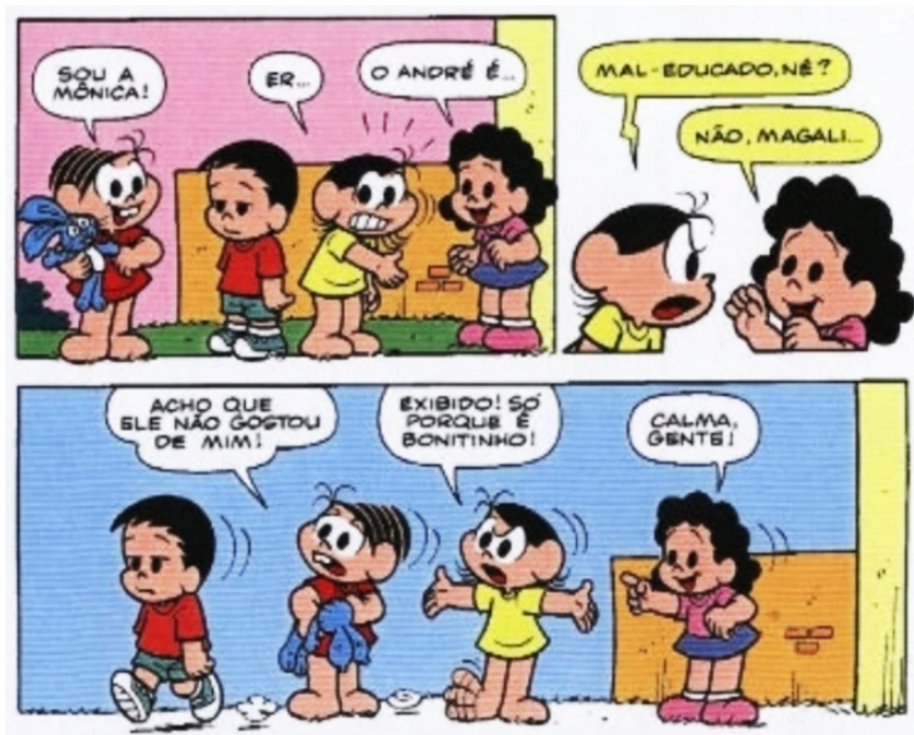
Figura 07 - Autismo e comunicação