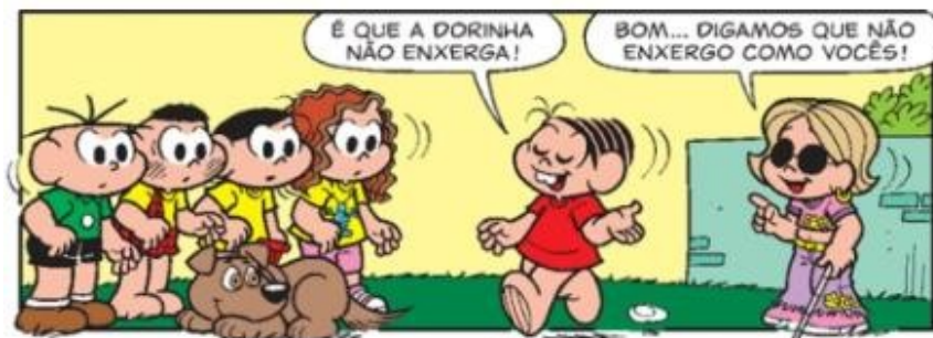
Figura 05 – Enxergar diferente