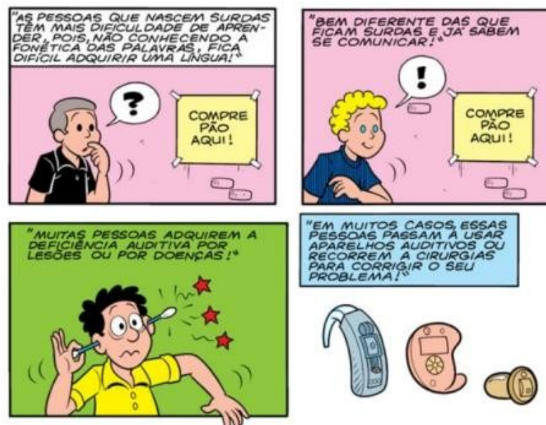
Figura 02 – Explicando a deficiência auditiva Fonte: SOUSA, 2011

Como se pode observar na figura abaixo, a surdez é debatida, e suas possíveis causas são apresentadas naquela história. No quarto quadro, possíveis tratamentos também são exibidos. A sequência narrativa da história é didática, sendo fácil a compreensão sobre o tema da deficiência auditiva.