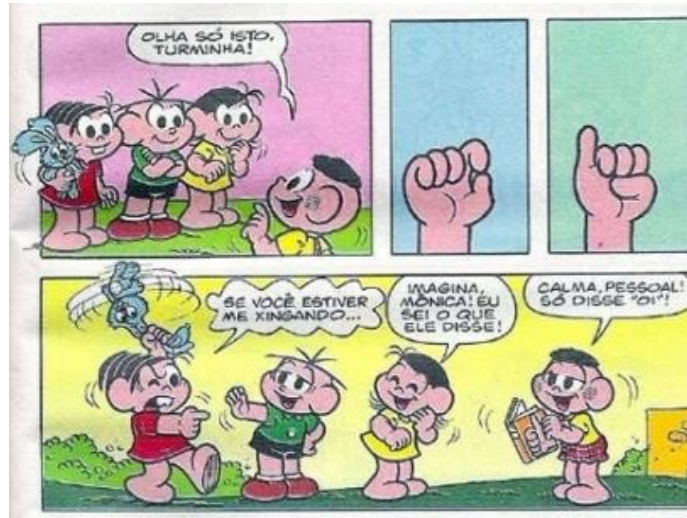
Figura 03 - Língua de sinais Fonte: SOUSA, 2006, p. 39

auditiva, como o desconhecimento acerca dessa língua gera mal-entendidos e preconceitos. A Língua de Sinais não é um simples movimento manual a fim de possibilitar um diálogo entre pessoas surdas. Ela forma um conjunto linguístico estruturado, com regras definidas como as linguagens orais.