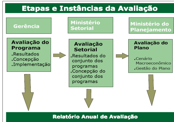
Figura 1 - Etapas e instâncias da Avaliação dos Programas e do PPA iv