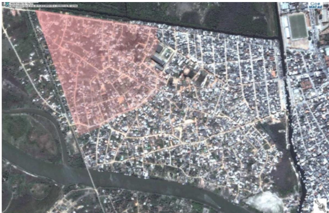
Figura 3 - Perspectiva da localidade de Nova Esperança e Nova Holanda no bairro de Barra de Macaé, com ênfase na área em vermelho do terço urbanizado pela intervenção objeto de análise.