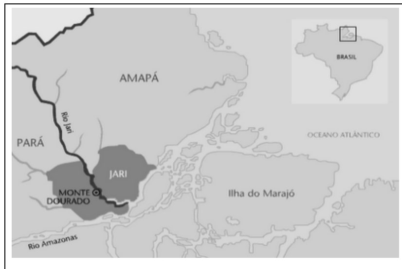
Figura 1 - Mapa de localização do Vale do Jari.

Segundo Greissing (2010), essa região se caracteriza por uma floresta primária tropical muito rica em recursos naturais, principalmente, a castanha ( bertholletia excelsa ) e a seringa ( hevea brasiliensis ). Essas culturas foram às principais fontes de exploração das populações extrativistas. Além de ainda serem importantes recursos para a economia regional. Na figura 01 é possível observar a localização do Vale do Jari.