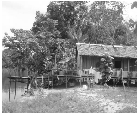
Foto 1 e 2 - Casas da Vila de Iratapuru.