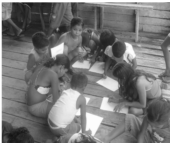
Foto 3 - Crianças participando da dinâmica do desenho.

o rio, os peixes, barcos, e casas sobre o rio simbolizando a relação entre as crianças e a natureza. (ver foto 03 e figura 03).