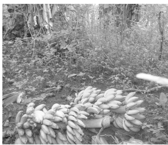
Fotos 3 e 4 - Típica roça de toco da comunidade de Iratapuru.