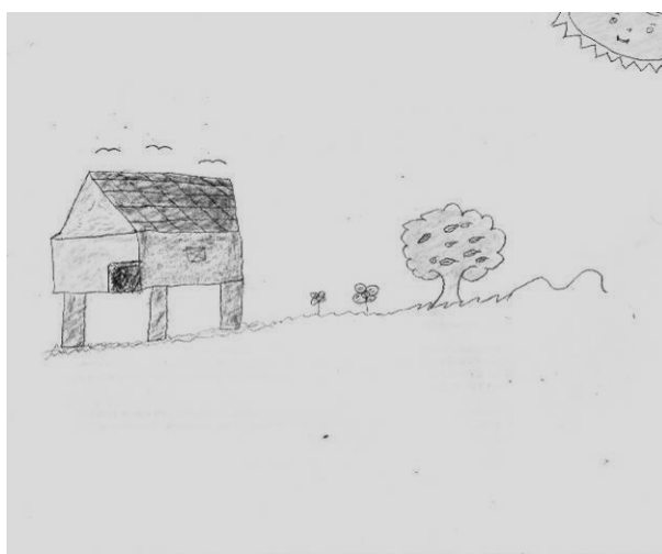
Figura 3 - Neste desenho as crianças procuraram destacar as casas na palafita.

Fonte: Desenhos das crianças da Vila de Iratapuru.