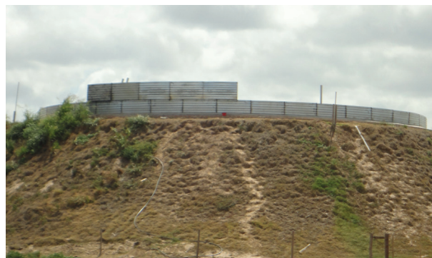
Figura 2 - Exemplo de uma “loma” de aproximadamente 12 m de altura erguida com terra, pode-se visualizar um reservatório construído com folhas de zinco com capacidade para um milhão de litros de água.

Fato interessante é o modo como é feita a distribuição de água dos reservatórios centrais para os bebedouros nos pastos. Por falta de declividade da região do Chaco Boliviano costuma-se fazer um aterro, no qual constrói-se um reservatório de água por cima (Figura 2). Este aterro é denominado pelos bolivianos de “loma”, que em espanhol significa pequeno monte de terra. Sob um aterro de 10 a 12 metros de altura e capacidade de um milhão de litros de água, foram construídas duas “lomas” na fazenda.