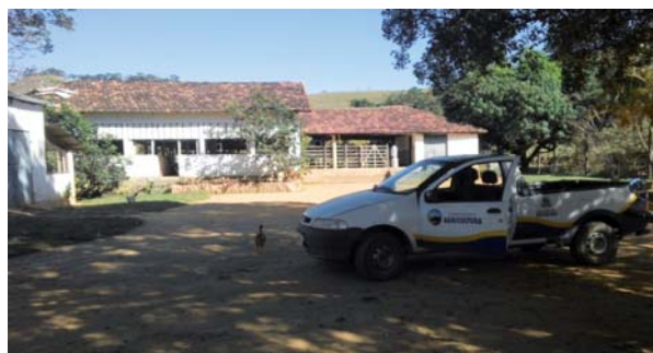
Figura 2 - Propriedade familiar inscrita no Programa Muriaé Pecuária, sendo visitada por um dos veterinários do programa.