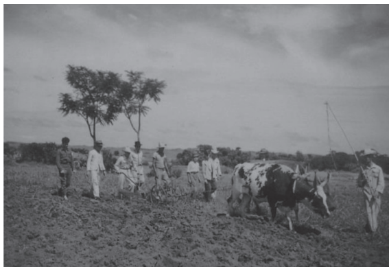
Figura 1 - Alunos trabalhando com arado na década de 1940.