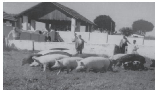
Figura 11 - Setor de Suinocultura na década de 1940.

A Figura 9 sinaliza o prédio administrativo em 1935 após reformas e ampliação, passando a sediar a Escola Profissional Agrícola Industrial Mista de Jacareí, a mesma edificação que abriga o setor administrativo da atual Etec Cônego José Bento, na Figura 10.