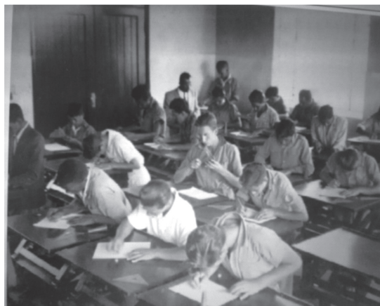
Figura 7 - Aula de desenho na década de 1940.

Segundo o decreto nº 7.319 de 05 de julho de 1935, o que levou à criação de uma escola técnica em Jacareí teria sido o fato de se localizar próxima a Estrada de Ferro Central do Brasil, dado o desenvolvimento da agrimensura e pecuária nessa zona. Por esse motivo e pelo fato da escola ter desenvolvido uma atividade voltada à agricultura durante décadas o colégio é tradicionalmente conhecido até hoje como Escola Agrícola, apesar de ter ampliado seus cursos e modernizado sua infraestrutura, como apontam as Figuras 7 e 8.