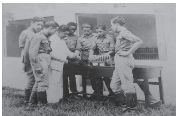
Figura 3 - Aula de avicultura na déc. de 1940.