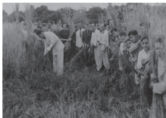
Figura 6 - Colheita do trigo na déc. de 1940.