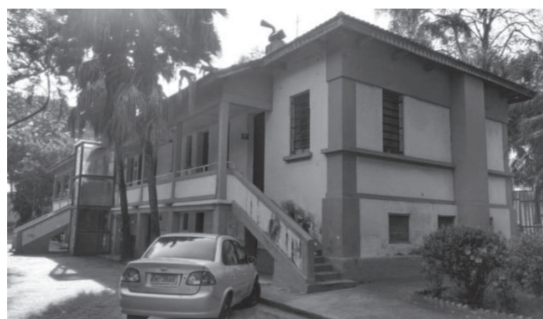
Figura 10 - Prédio Administrativo (2017).

A Figura 9 sinaliza o prédio administrativo em 1935 após reformas e ampliação, passando a sediar a Escola Profissional Agrícola Industrial Mista de Jacareí, a mesma edificação que abriga o setor administrativo da atual Etec Cônego José Bento, na Figura 10.