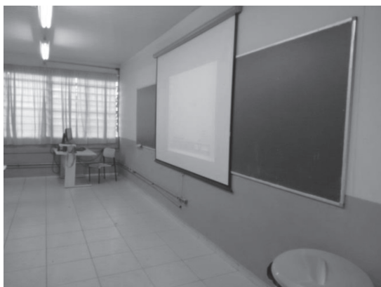
Figura 8 - Espaço de sala de aula em 2017.

em homenagem ao seu fundador, que deixou em testamento todos os seus bens para os meninos pobres de Jacareí. Em 1935, aproximadamente, o então prefeito da cidade ampliou e reformou o prédio que passou a ser uma escola agrícola. Na Figura 10, as alterações observadas, assim como algumas instalações de criações de animais (Figura 11 e 12).