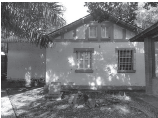
Figura 13 - Entrada do Centro de Memória.