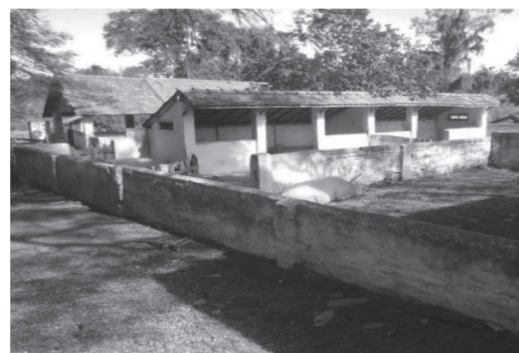
Figura 12: Setor de Suinocultura (2017)

A Figura 11 representa o setor de suinocultura na década de 1940. A figura 12 apresenta o local mantido tanto para criação de suínos como para a execução das aulas práticas.