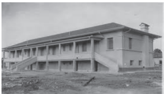
Figura 9 - Prédio administrativo na década de 1930. Fonte: http://www.jacareitempoememoria.com.br . Acesso em: 22 de setembro de 2016.