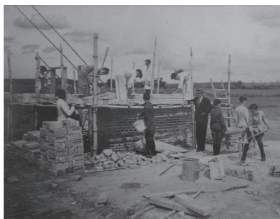
Figura 5 - Aula de alvenaria na déc. de 1940.