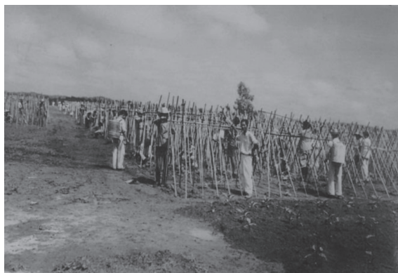
Figura 2 - Horticultura (plantação de pepino e tomate), déc. 1940.

Fonte: Arquivo Público e Histórico de Jacareí. Acesso em: março de 2017.