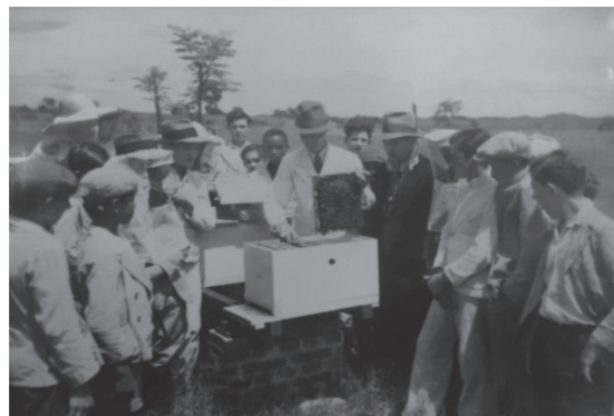
Figura 4 - Aula de apicultura na déc. de 1940.