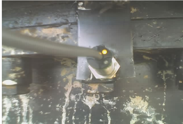
Figura 2. Posição do sensor instalado na base da máquina.

A posição do sensor, que era inicialmente vertical à base da máquina, foi alterado para a posição horizontal devido à incidência de erros causados pela distância dos parafusos ao sensor (Figura 2).