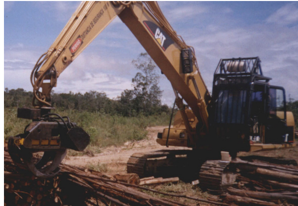
Figura 1. Vista geral da garra traçadora.

O trator utilizado neste trabalho foi uma escavadora hidráulica, modelo 320 CL, fabricante caterpillar, com 103 kW de potência nominal do motor. Na Figura 1 é mostrada a escavadora hidráulica adaptada com a garra traçadora.