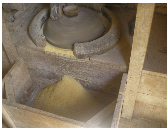
Figura 02 - Beneficiamento do milho realizado nos moinhos.