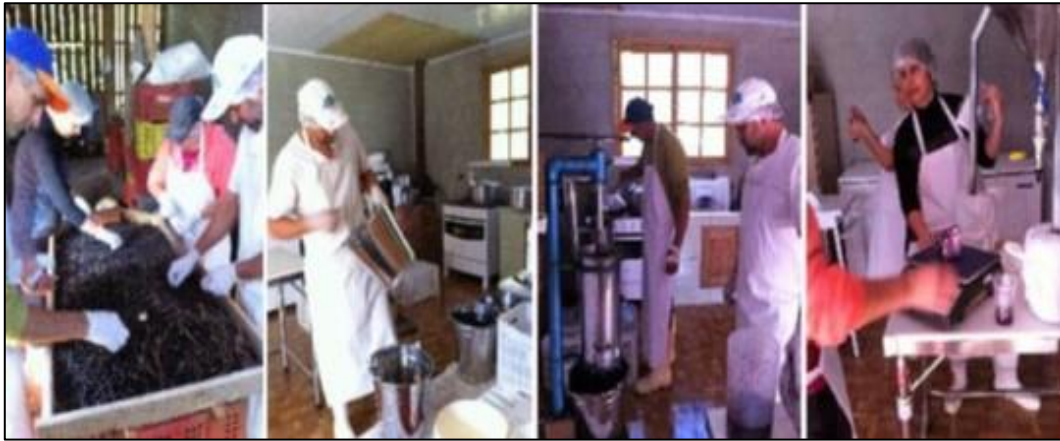
Figura 3: Processamento do fruto de juçara para extração da polpa (etapas)