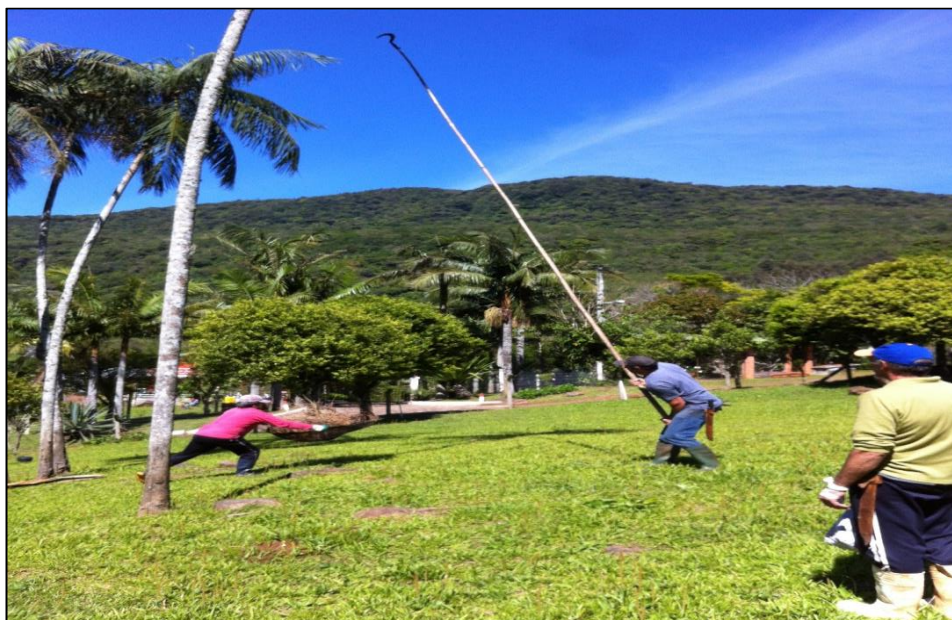
Figura 2: Coleta de frutos da palmeira-juçara