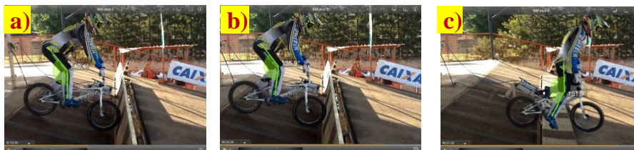
Figura 1 - Posição estática (a), primeiro movimento (b) e desprendimento (c).

Os três ângulos detectados foram mensurados em três diferentes momentos da largada (Figura 1). O primeiro ângulo, chamado de estático, foi aquele em que o atleta estava imóvel na bicicleta, esperando o sinal da largada (Figura 1a); o segundo ângulo, chamado de primeiro movimento (Fig. 1b), foi considerado o momento em que o atleta faz o primeiro movimento e tira o contato da roda com o portão de largada; e o terceiro ângulo, chamado de desprendimento (Figura 1c), que é o momento no qual o atleta ultrapassa o portão de largada, iniciando a prova (Figura 1).